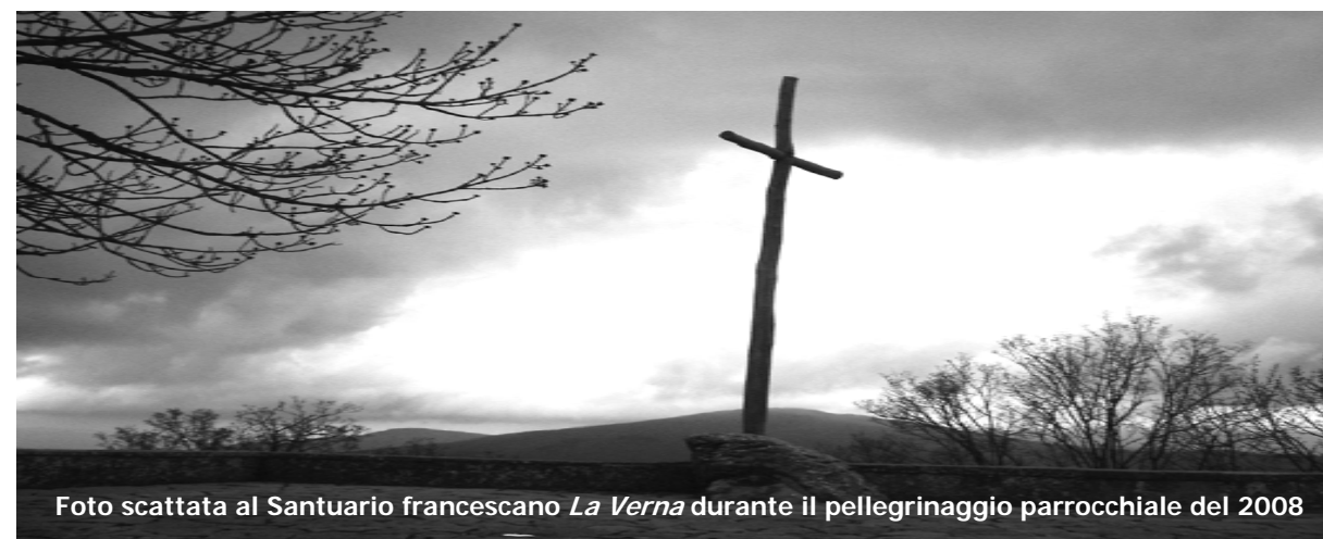
Foto scattata al Santuario francescano La Verna durante il pellegrinaggio parrocchiale del 2008